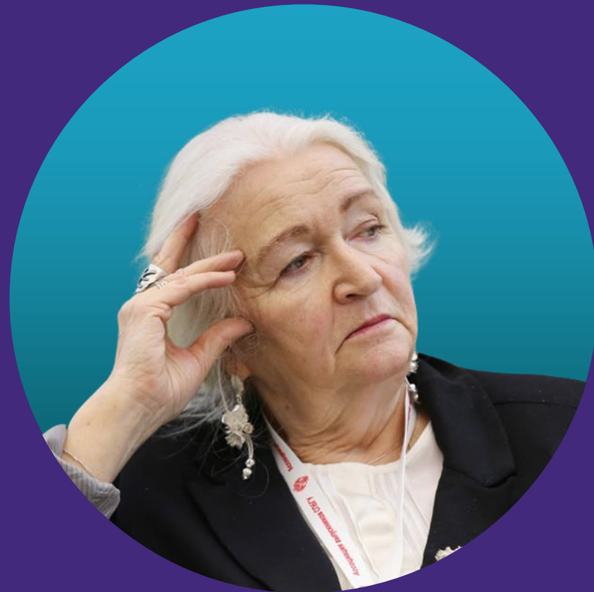
Татьяна Владимировна Черниговская

Российский учёный в области нейронауки и психолингвистики. Заслуженный деятель высшего образования и Заслуженный деятель науки РФ.