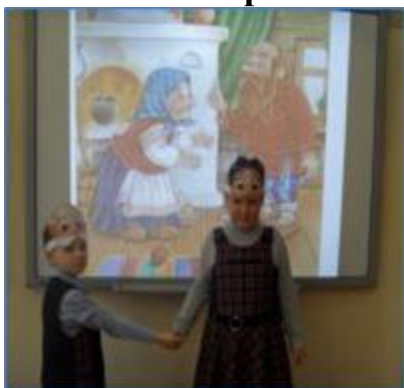
Участие в спектаклях