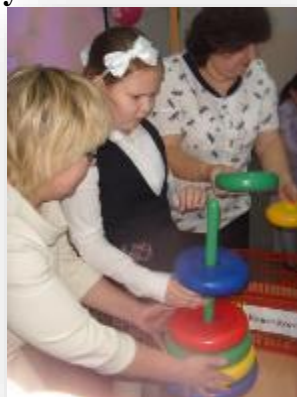
Участие в конкурсах