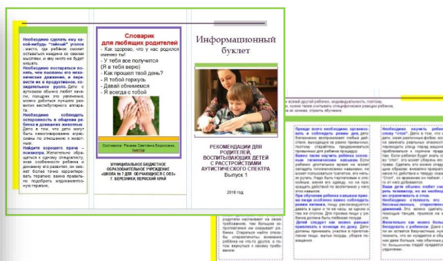
Серия буклетов для родителей