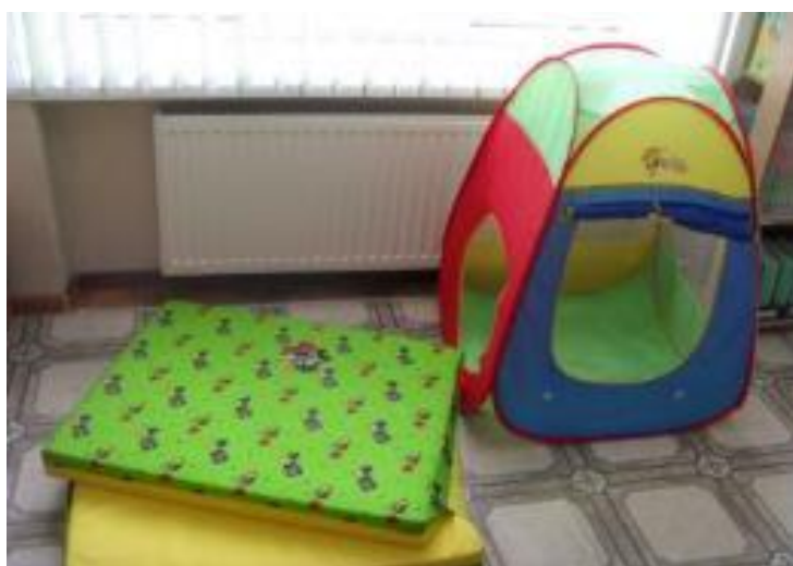
Фото 3 – создание комфортной среды