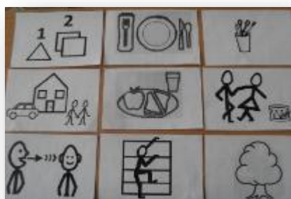
Карточки - алгоритмы