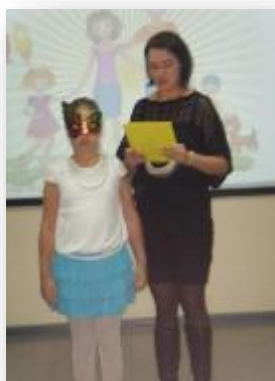
Участие в конкурсах и фестивалях