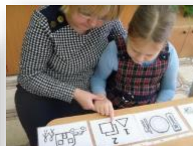
Работа с расписанием