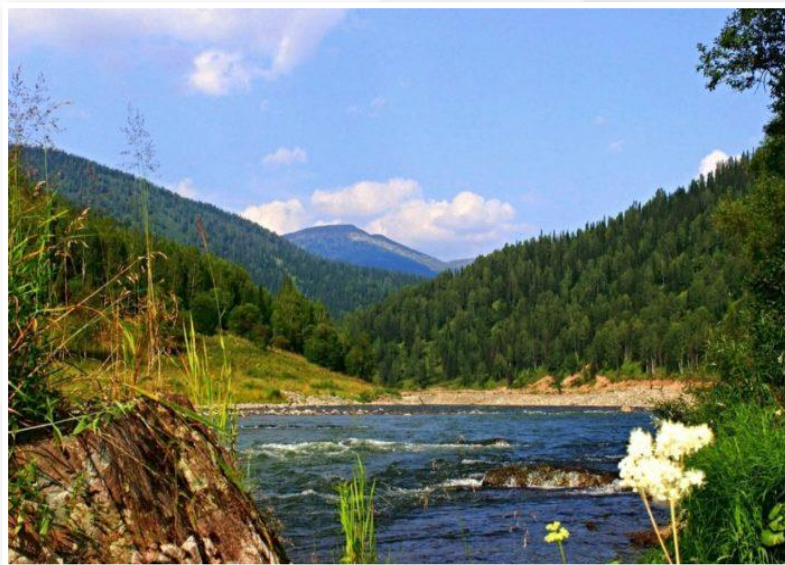
Заповедник «Кузнецкий Алатау»