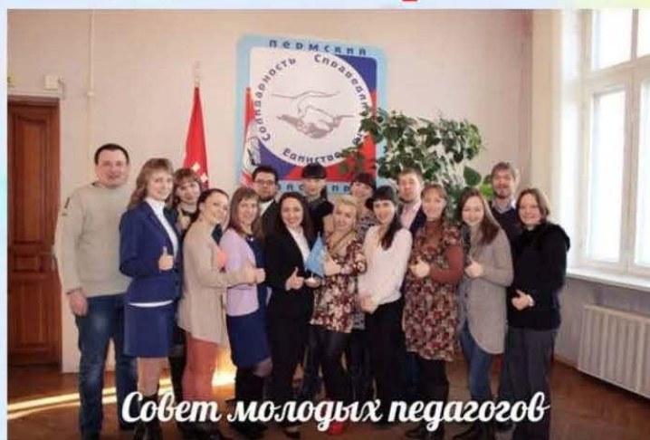
Совет молодых педагогов