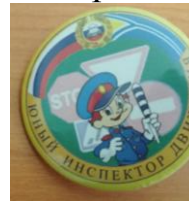
Эмблема отряда ЮИД