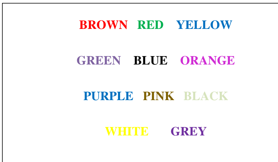
Рис. 2. Раздаточный материал для игры «Colours».