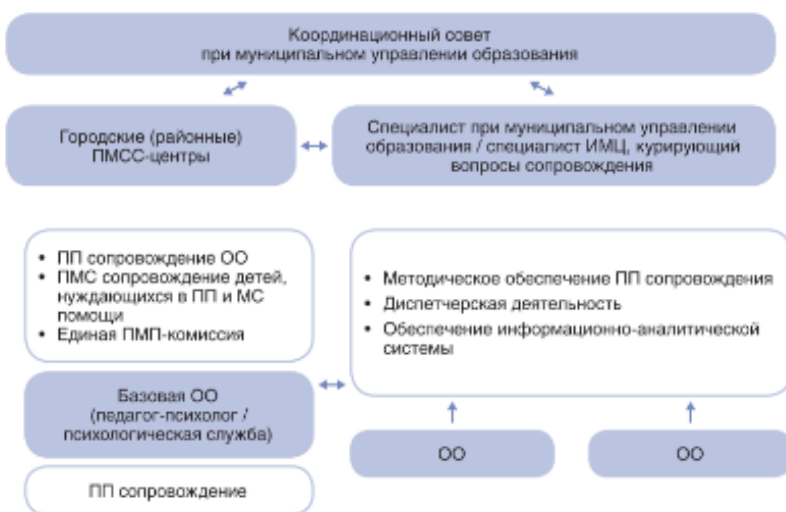
Рис. 2. Модель обеспечения психолого-педагогических условий в ОО – сетевое взаимодействие