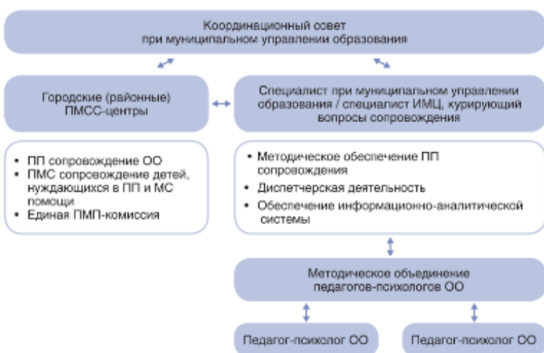
Рис. 1. Модель обеспечения психолого-педагогических условий в ОО при наличии штатного педагога-психолога

В условиях реализации ФГОС ОО организация деятельности педагога-психолога (психолого-педагогической службы) может осуществляться на основе разных моделей, которые выбирает образовательная организация совместно с муниципальными органами образования исходя из имеющихся возможностей и условий: модель со штатным специалистом ОО (рис. 1) и модель сетевого взаимодействия (рис. 2).