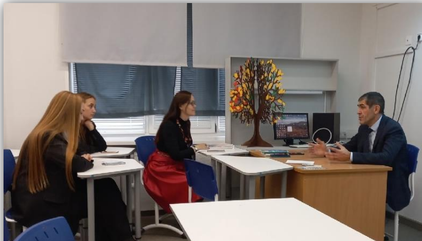
Мастерская с главой Осинского ГО Григорьевым А.В.