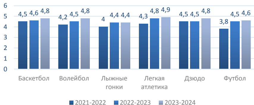
средний балл переводной и итоговой аттестации по общеразвивающим программам