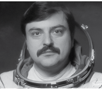
Муса Хираманович Манаров – летчик-космонавт СССР. Выпускник Калининской СОШ 1969 г.

Цель программы – воспитать здоровых и сильных ребят. Эмблема – стриж и 14 звездочек вокруг него. Программа развития юных космонавтов: «Дорога к звездам». Любимые песни «Стрижей»: «Я верю, друзья» и «Трава у дома».