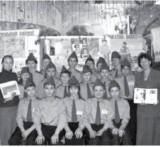
Класс «Юные космонавты» Калининской СОШ