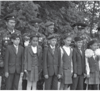
Класс «Юные пограничники» Калининской СОШ

материалу, как усваивают различные элементы содержания, позволяет наставникам рационально организовать весь учебный процесс и добиться высокого качества знаний.