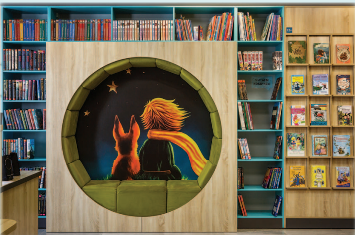
Пример радиального баланса: реализованный проект Центральной городской библиотеки г. Берёзовский

Баланс должен быть настолько хорошим, чтобы глаз зрителя/гостя легко смог скользнуть от одного объекта к другому, находя опорные точки и их поддержку. Конечно, можно сознательно нарушить эти правила ради получения эффекта падения, нарушения композиции и вызвать дополнительно эмоции от дисбаланса как приёма деконструктивистов в архитектуре. Но делать это для помещений библиотек аккуратно и исключительно сознательно – от профессионализма, а не случайным нарушением гармонии.