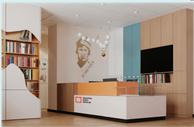
Так решена задача выделить композиционно центральную стойку и сделать её доминантой в библиотеке-филиале № 2 Берёзовской ЦБС в Старопышминске