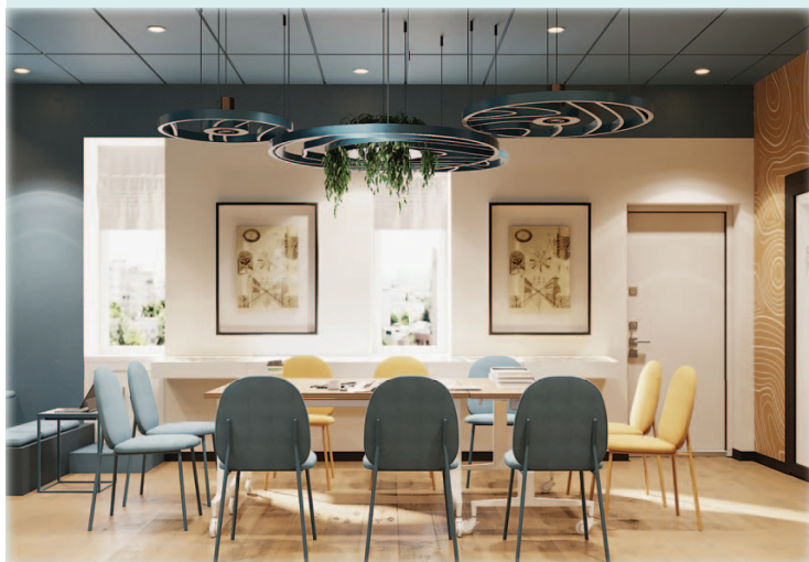
Пример симметрии: дизайн-проект библиотеки-филиала № 2 Берёзовской ЦСБ в Старопышминске

1. БАЛАНС ИЛИ ПРОПОРЦИИ. В физике равновесие – это точка, в которой объект достигает состояния покоя, а действующие на него силы компенсируют друг друга. В сбалансированной композиции все элементы распределены таким образом, что кажется, будто их нельзя передвинуть. Произведение должно выглядеть цельным. Несколько принципов баланса: