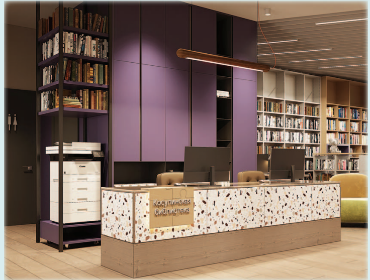
Дизайн-проект Косулинской сельской библиотеки Белоярского городского округа

В проекте Косулинской сельской библиотеки центральная стойка и активное пятно за ней иллюстрируют оба принципа. Это доминанта как по размеру, так и по цвету. Никаких сомнений, куда идти, зайдя в помещение.