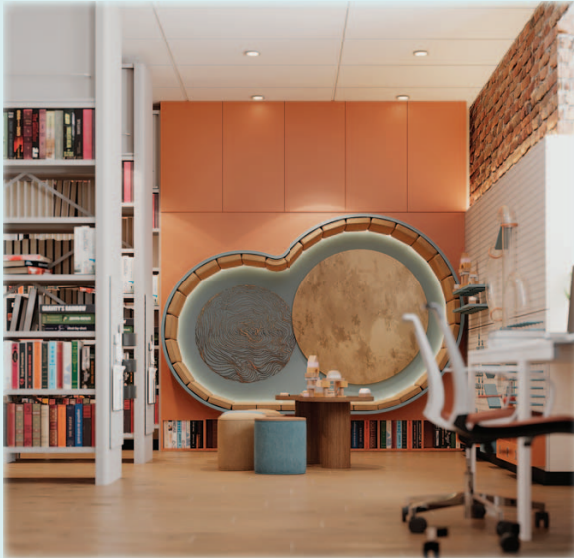
Пример использования нюансовых цветов в дизайн-проекте библиотеки-филиала № 2 Берёзовской ЦБС в Старопышминске