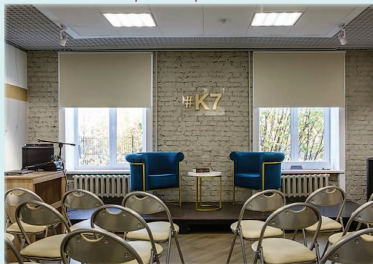
Событийная площадка «Марсианские хроники»