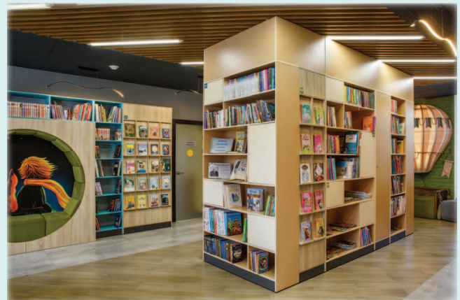
Пример контраста форм в Центральной городской библиотеке г. Берёзовский

Притягиваем внимание за счёт изменения формы. Круглая ниша и активный рисунок внутри создаёт контраст к прямоугольной композиции стеллажей. Воздушный шар в поддержку этой ниши заманивает заглянуть за угол. Пространство воспринимается динамически, линии потолка и светильники-волны дополняют эффект. Решения не случайны и образуют общую гармонию.