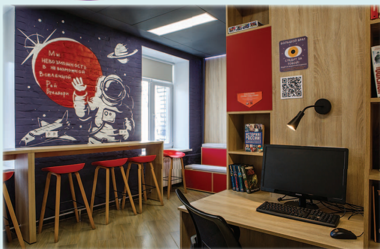
Реализованный проект Центральной городской библиотеки г. Берёзовский

Активный красный на переднем плане против холодного фиолетового на фоне создаст активное выделение цветом центра композиции