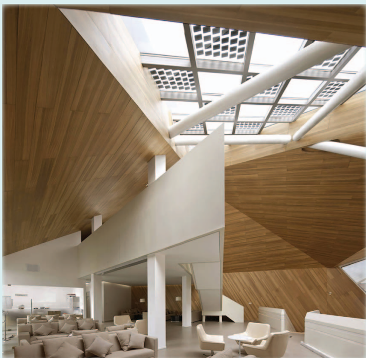
Приём деконструктивизма в архитектуре: Institutional buildings Tianjin, China. Автор проекта Mochen Architects & Engineers

Баланс должен быть настолько хорошим, чтобы глаз зрителя/гостя легко смог скользнуть от одного объекта к другому, находя опорные точки и их поддержку. Конечно, можно сознательно нарушить эти правила ради получения эффекта падения, нарушения композиции и вызвать дополнительно эмоции от дисбаланса как приёма деконструктивистов в архитектуре. Но делать это для помещений библиотек аккуратно и исключительно сознательно – от профессионализма, а не случайным нарушением гармонии.