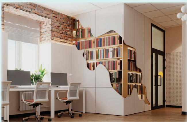
Образец использования темы «драгоценной жилы» в дизайн-проекте библиотеки-филиала № 2 Берёзовской ЦБС в Старопышминске