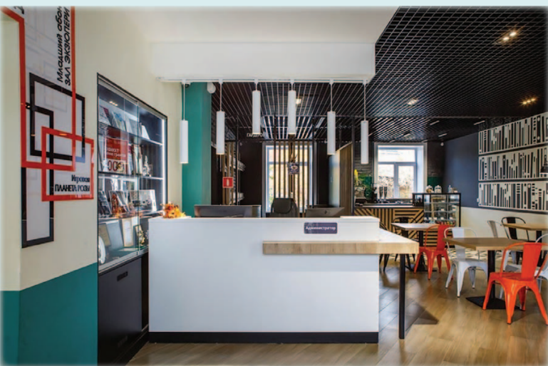
Холл библиотеки и литературное кафе «Ракетное лето»

Идея нашей дизайн-концепции и стиля «лофт» позволяет сочетать новые тенденции и старые приёмы как на уровне визуального оформления, так и на символическом уровне, подчёркивая и придавая новые смыслы и образы такому, казалось бы, консервативному пространству, как библиотечное, тем самым помогая менять сложившиеся стереотипы восприятия библиотеки населением и привлекать новых посетителей. Дизайн отвечает характеру современных энергичных людей. Он становится продолжением динамичного ритма города в пространстве библиотеки.