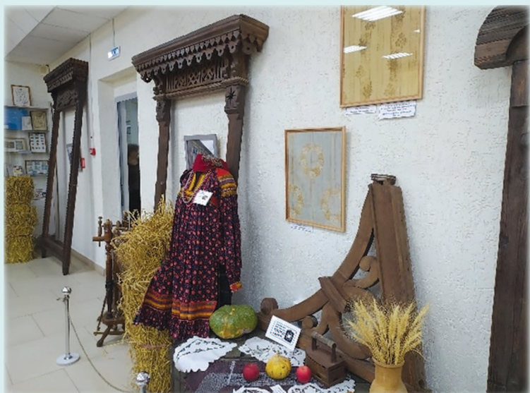
Центральная городская библиотека им. С.А. Есенина, г. Рязань.