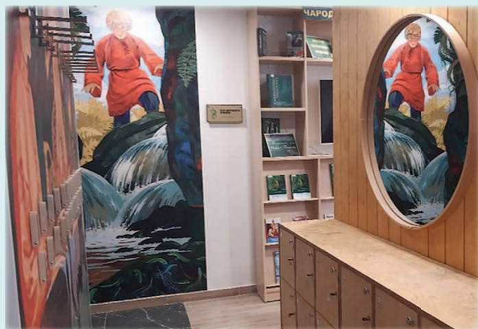
Центральная городская библиотека им. П.П. Бажова.

Взрослый абонемент – зал Брэдбери – сочетает функции абонемента и читального зала с местами уединённого чтения. Актуальный фонд разме-