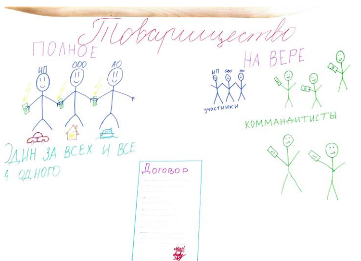
Рисунок 1. «Формы организации бизнеса»