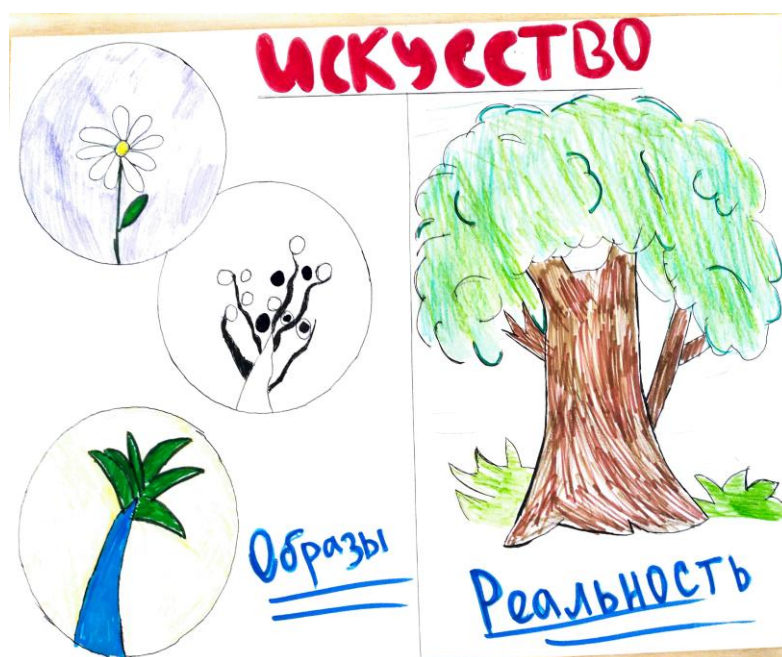
Рисунок 1. Многообразие путей познания мира «Искусство»