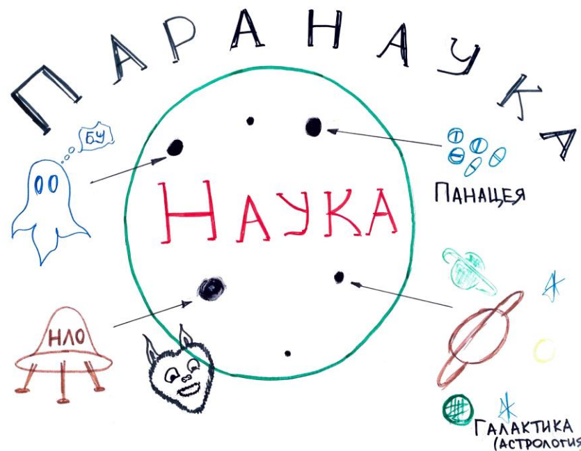
Рисунок 2. Многообразие путей познания мира «Паранаука»