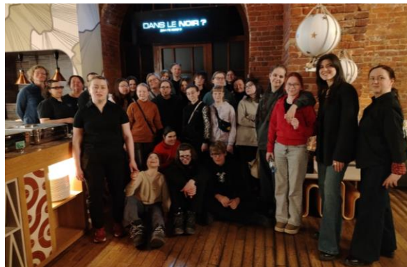
Встреча с сотрудниками ресторана «В темноте»

Завершающая вечерняя прогулка по знаковым местам Санкт-Петербурга (Исаакиевский и Казанский соборы, Спас на Крови, крейсер «Аврора», «Медный всадник», Мариинский театр, Русский музей, памятник Пушкину) закрепила культурно-исторические знания и способствовала эмоциональной рефлексии.