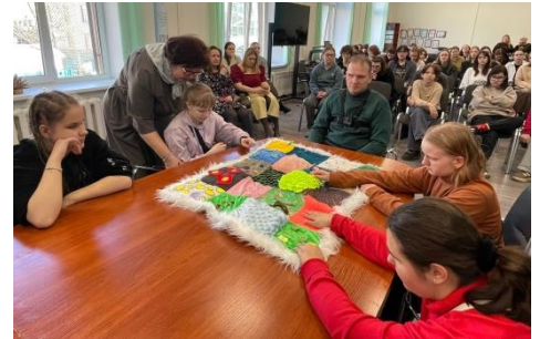
Встреча с преподавателями и студентами РГПУ им. Герцена