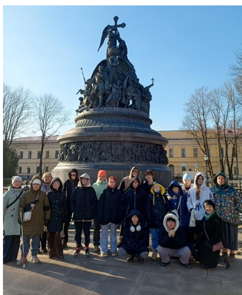
Памятник «1000-летия Руси»