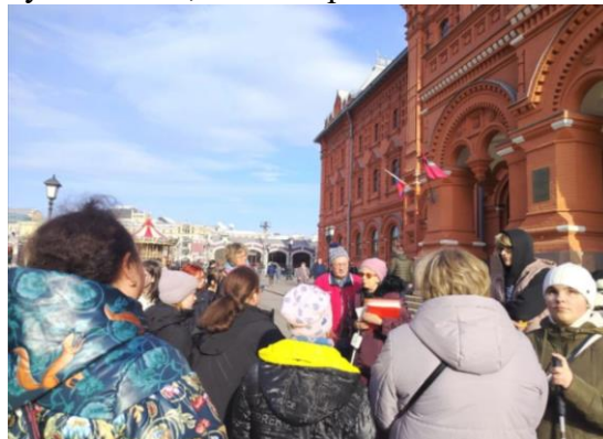
Встреча со специалистами КСРК ВОС и экскурсия по Красной площади

Экскурсионная программа в Великом Новгороде стала для участников экспедиции путешествием сквозь века. Проводником в прошлое новгородской земли в эпоху становления государственности России стал для нас замечательный экскурсовод. Поняв задачи нашей экспедиции, она провела экскурсию по Новгородскому кремлю и его музеям, сделав акцент на ремесленниках и трудовых традициях новгородской земли. Познакомила нас с берестяными грамотами и с Новгородцами, которые их писали десятком веков назад. Участники экспедиции поняли, что в России народ всегда был трудолюбив и те стародавние времена, каждый гражданин вносил свой посильный вклад в благосостояние своей Родины. Это понимание укрепилось при подробном знакомстве с памятником «1000-летие Руси», на котором отлиты фигуры исторических личностей, правителей и простых людей, внесших особый вклад в развитие Российского государства. В «Витославицах» - музее деревянного зодчества, участники ощутили связь времён через прикосновение к быту крестьян — и в этом соприкосновении с прошлым зародились новые мысли о своем будущем у каждого участника экспедиции.