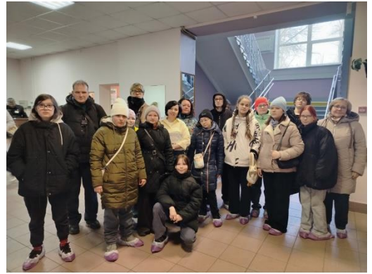
Посещение медицинского колледжа С. Петербурга