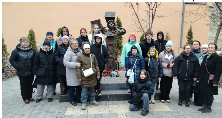
Памятник незрячим защитникам неба блокадного Ленинграда

Завершающая вечерняя прогулка по знаковым местам Санкт-Петербурга (Исаакиевский и Казанский соборы, Спас на Крови, крейсер «Аврора», «Медный всадник», Мариинский театр, Русский музей, памятник Пушкину) закрепила культурно-исторические знания и способствовала эмоциональной рефлексии.