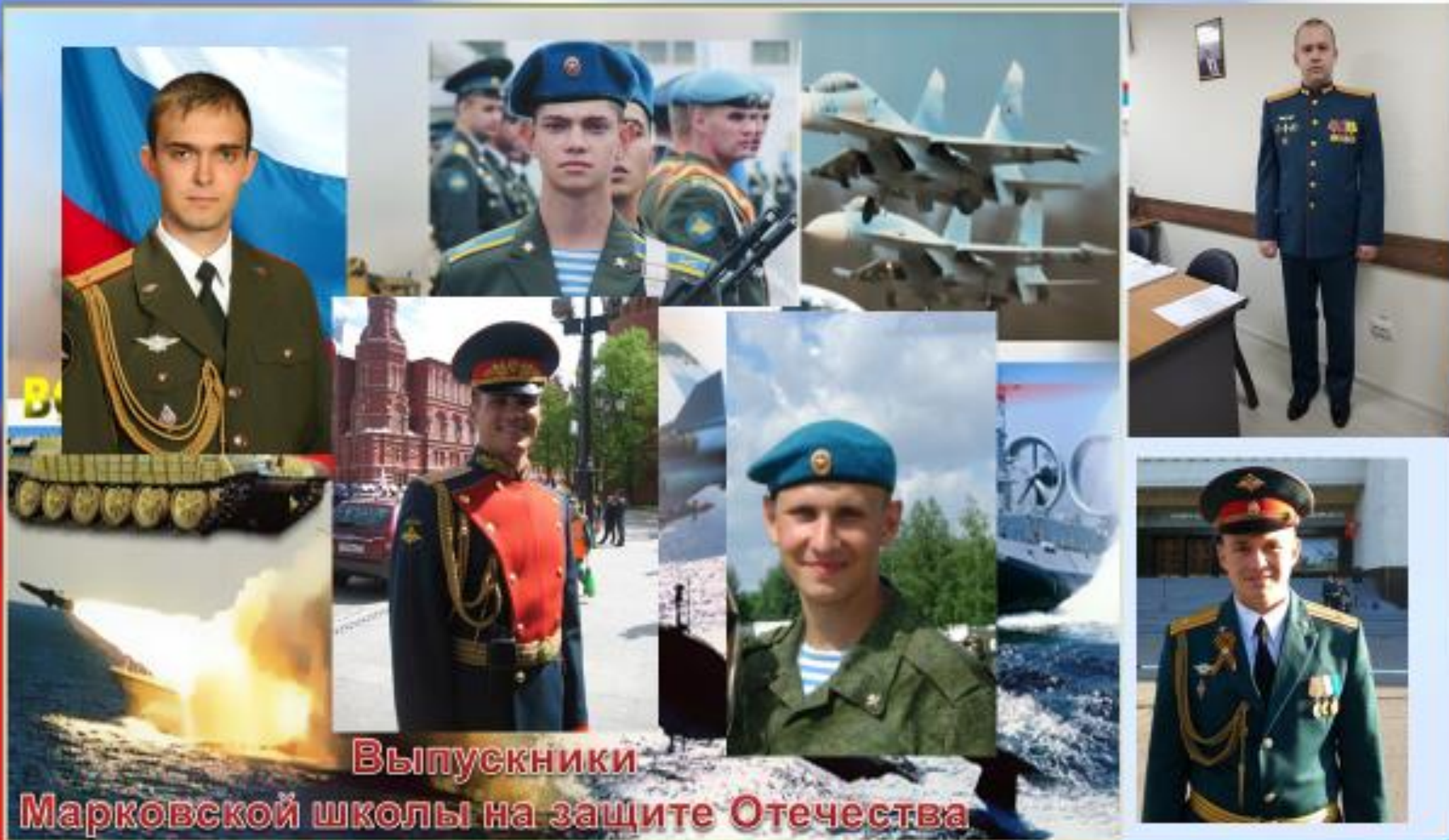
Выпускники Марковской школы на защите Отечества