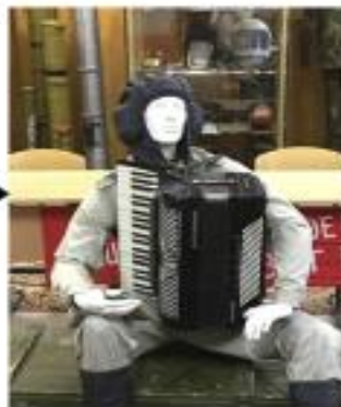
Трофейный немецкий аккордеон Royal standard