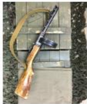
Пистолет – пулемёт Шпагина (ППШ)