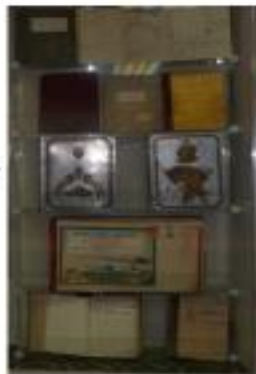
Журналы боевых действий частей соединения